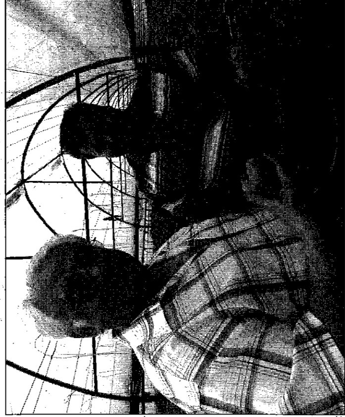
Membri cooperativa Vidra

Urmăresc de câteva luni, uneori de la fața locului, alături din birou, câteva experimente sociale fascinante. Este vorba despre cele patru asociații agricole-pilot, dezvoltate de Romanian-American Foundation, prin intermediul a patru ONG-uri. Premisa proiectului este simplă: înainte de bani, aceste comunități au nevoie de încredere între oameni și de planuri de afaceri. Ce veți citi în continuare este povestea acestui experiment, aflat încă la început. O fotografie foarte sumară și încă în mișcare.